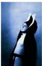
The fashion finalists for ITS 2012

http://www.itsweb.org/jsp/en/newsdetail/selectedid_334.jsp