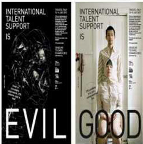
ITS - Good or Evil? - Tema dell'anno

I giovani talenti di International Talent Support saranno presenti alla manifestazione fiorentina